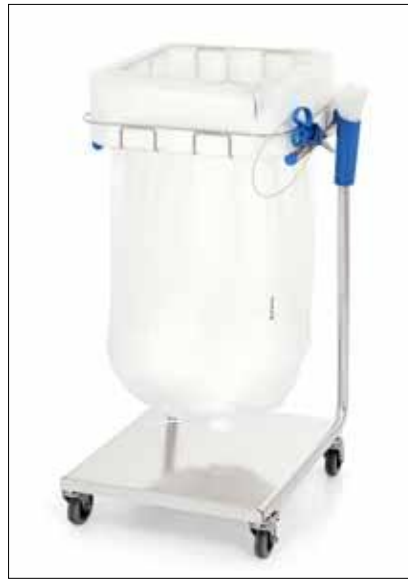
Stand Dynamic Midi/Midi Pedal