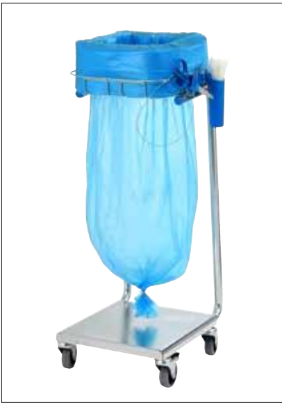
Stand Dynamic Mini/Mini Pedal