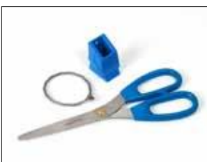
Scherensatz für Longopac Stand Dynamic, metall-detektierbar Item no. 34609

Verkleinert die Einwurfföffnung und ermöglicht eine einfachere Komprimierung z.B. von Recyclingkunststoff. Nur für Maxi lieferbar.