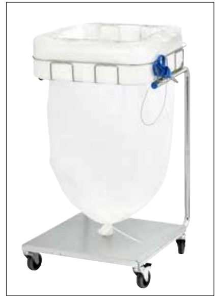
Stand Dynamic Maxi/Maxi Pedal