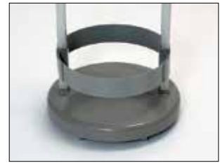
Umrandung für Longopac Stand Classic Mini Item no. 33890

Die Umrandung fixiert den Sack in seiner Position.