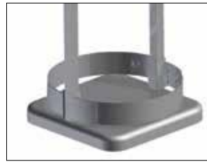
Umrandung für Longopac Stand Classic Maxi Item no. 33900

Zum einfachen und stabilen Verbinden mehrerer Longopac Stand-Einheiten. Auch Maxi und Mini lassen sich zusammenfügen.