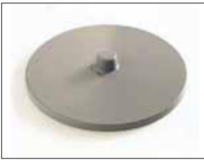
Deckel für Longopac Stand Classic Maxi und Mini

Mini. Item no. 31140 Maxi. Item no. 30140