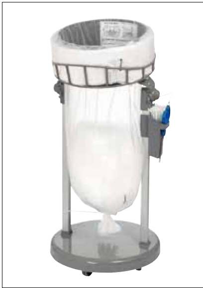
Stand Classic Mini/Mini Food