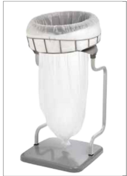
Stand Classic Recycling