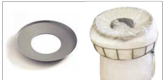
Lochscheibe für Longopac Stand Classic Maxi Item no. 30170

Verkleinert die Einwurfföffnung und ermöglicht eine einfachere Komprimierung z.B. von Recyclingkunststoff. Nur für Maxi lieferbar.