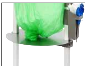
Verstellbare Platte für Stand Classic Mini Item no. 31480

Satz mit metalldetektierbarer Schere, Scherenhalter und Edelstahldraht.