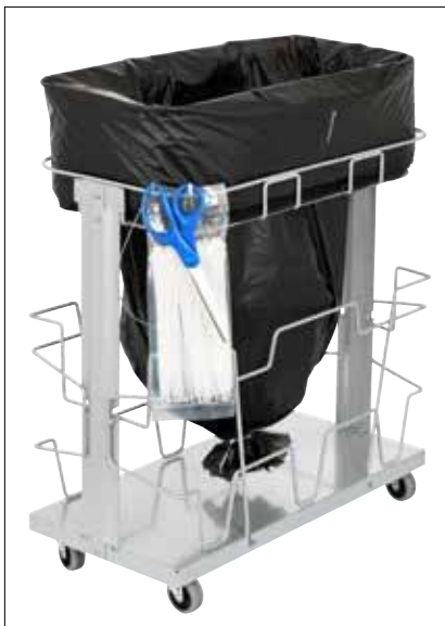
Stand Dynamic UBS