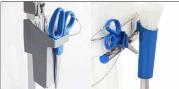
Kabelbinderhalter für Longopac Stand Classic Standard, grau. Item no. 30410 Metalldetektierbar, blau. Item no. 30416

Die Umrandung fixiert den Sack in seiner Position.