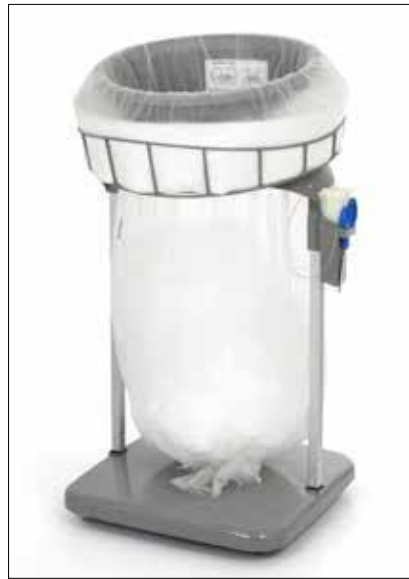
Stand Classic Maxi/Maxi Food