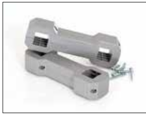
Ständeranschluss für Longopac Stand Classic Item no. 33750

Mini. Item no. 31140 Maxi. Item no. 30140